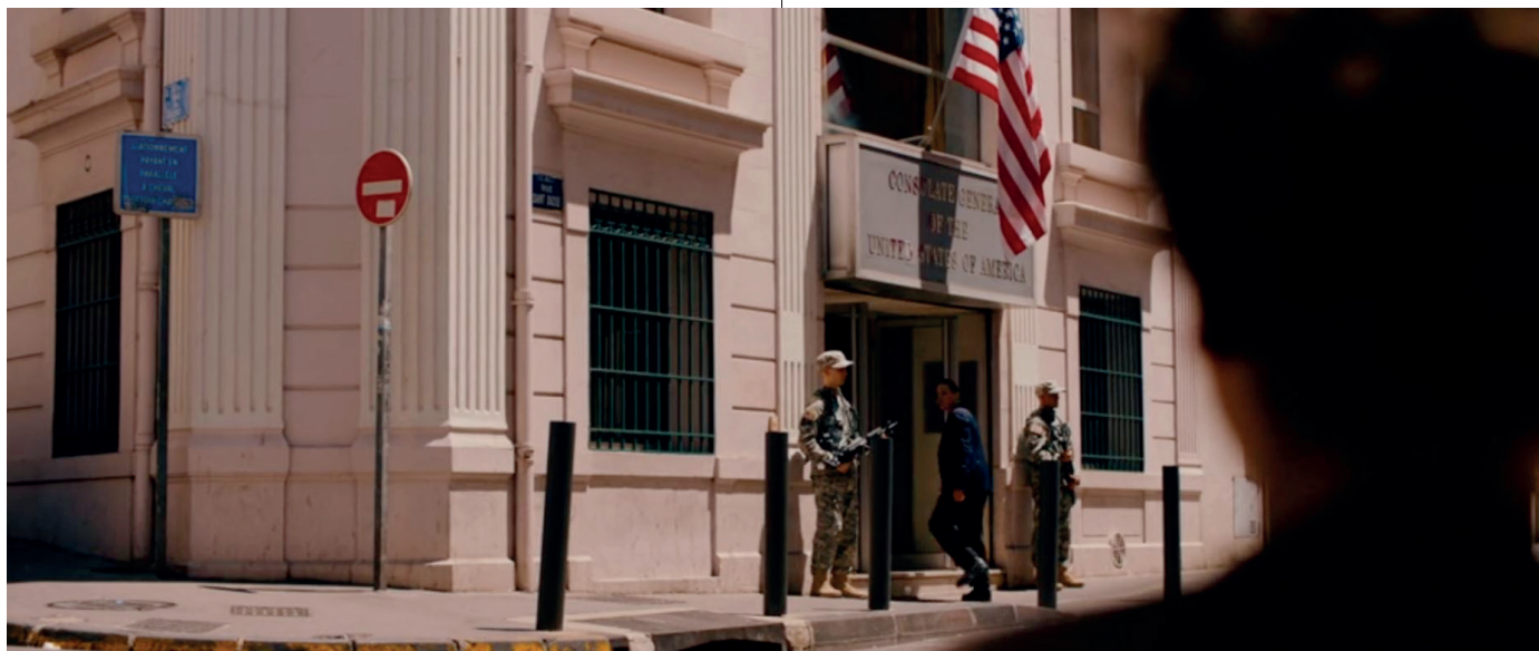
Abb. 7 Vor der amerikanischen Botschaft (wie Anm. 2)