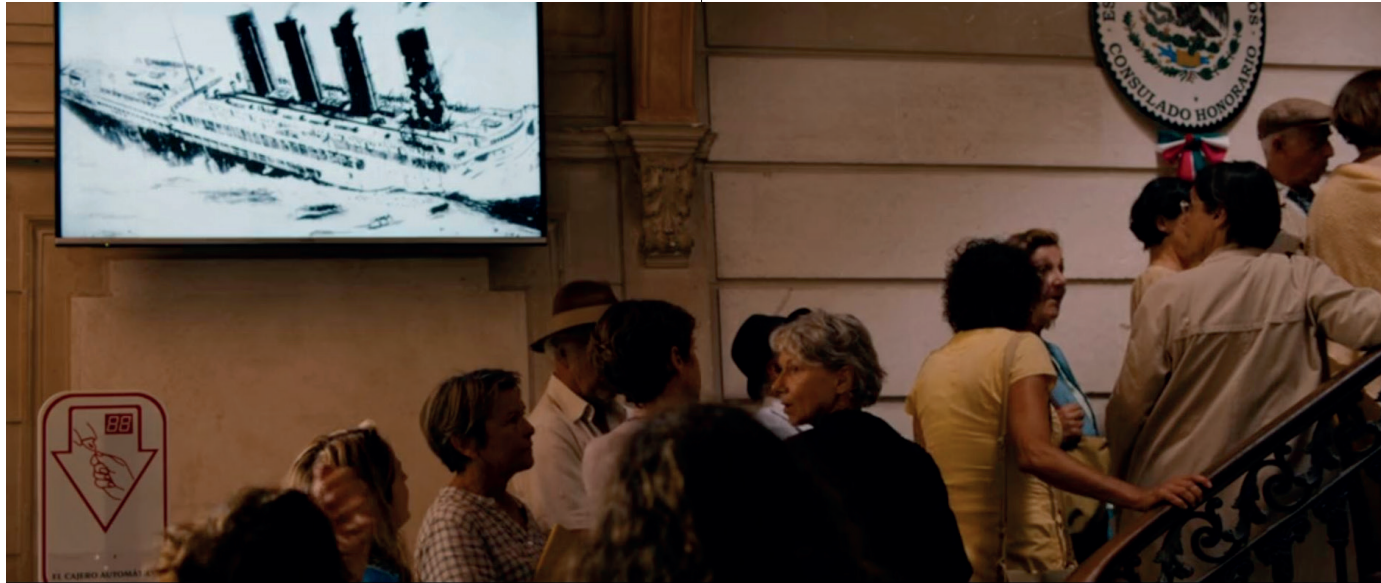
Abb. 11 Die Gegenwart des Historischen im mexikanischen Konsulat (wie Anm. 2)

Menschen das endlose Warten auf die richtigen Dokumente tatsächlich das Leben gekostet hat, lässt sich anhand der Vielzahl geschriebener oder aber ungeschriebener geliebener Biografien nur erahnen. Auch in Petzolds Film werden Menschen von der zeitverzehrenden Warterei aufgerieben oder in Verzweiflung und Tod getrieben: Neben dem eigentlichen Schriftsteller und einem Komponisten (Justus von Dohnáni), der an Herzversagen stirbt, wird dort die Figur einer Architektin (Barbara Auer) entwickelt, die sich ausgerechnet vor der neuzeitlichen Kulisse des „Museums der Zivilisationen Europas und des Mittelmeers“ (MUCEM) in den Abgrund stürzt.