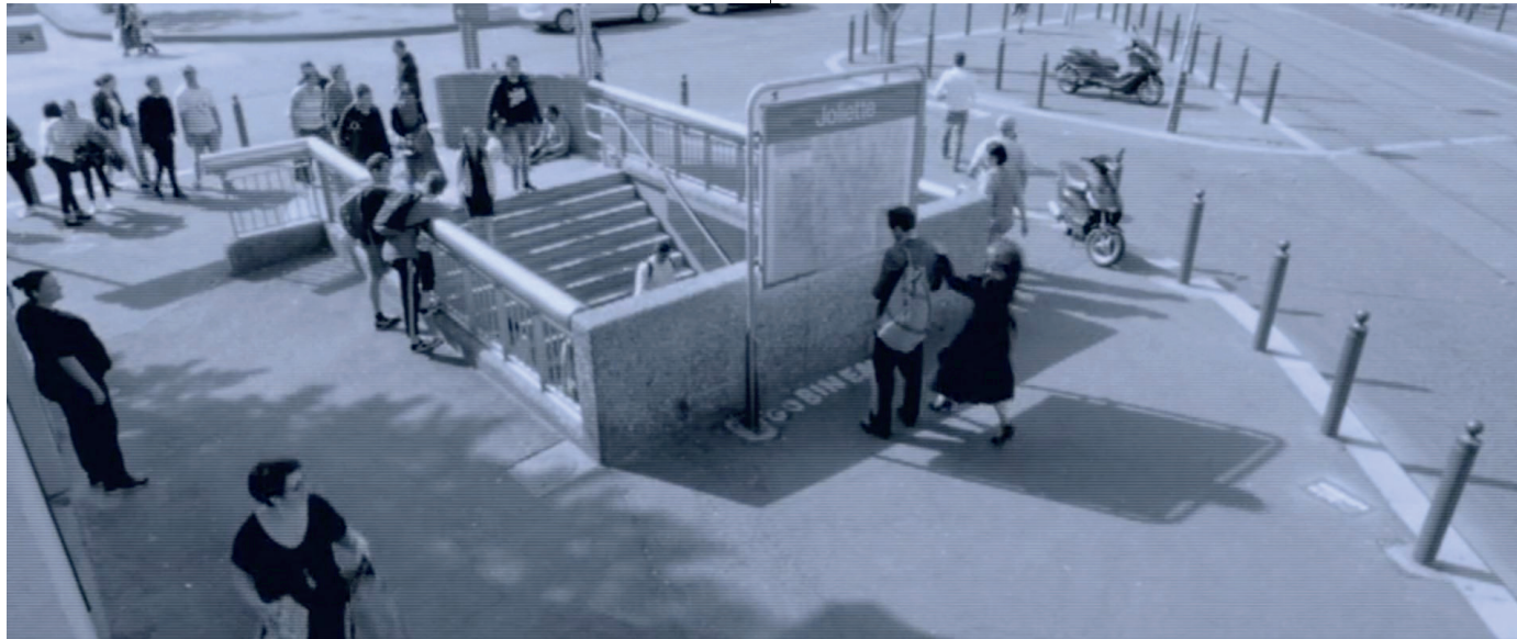
Abb. 8 Marie eilt zu Georg, den sie mit ihrem Mann verwechselt (wie Anm. 2)

Atmosphäre entfaltet die Erzählebene des Films nicht zuletzt aus dem düster gefassten Typoskript des Schriftstellers und der Verzweiflung und Furcht, die aus ihm spricht. Dort ist von einem Mann zu lesen, der erst Tage und dann Jahre vor einem großen Tor wartete, bis er sich endlich an einen Passanten wendete: „Vielleicht können Sie mir helfen. Ich soll mich in der Hölle melden,“ „Aber mein Herr!“ entgegnet ihm schließlich der Vorübergehende, „Das ist die Hölle hier!“ Die Szene könnte in Kafkas Parabel Vor dem Gesetz ein Vorbild erhalten haben. Als sogenannte Torhüterparabel ist die Geschichte 1915 als Teil des unvollendet gebliebenen Romans Der Prozess veröffentlicht worden. 12 Orson Welles hat die Erzählung in Verbindung mit einer Zeichentricksequenz in seiner