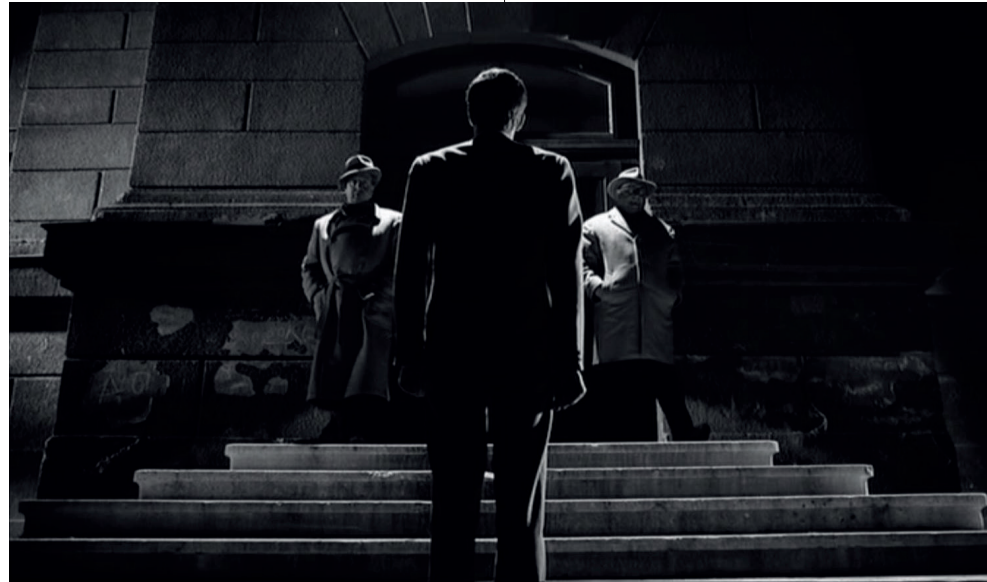
Abb. 9 Josef K. wird der Einlass verwehrt, Orson Welles, Le Procès, 1962