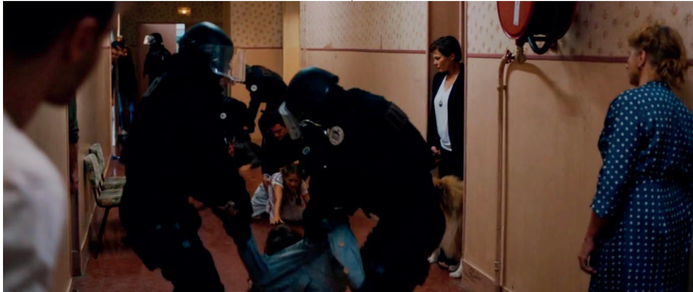
Abb. 6 Georg wird Zeuge einer Festnahme (wie Anm. 2)