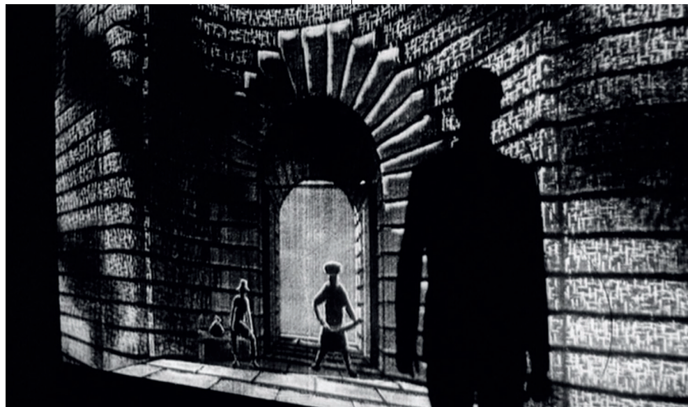
Abb. 10 Der Schattenwurf von Josef K. über den Projektionen nach Kafkas Torhüterparabel (wie Anm. 9)