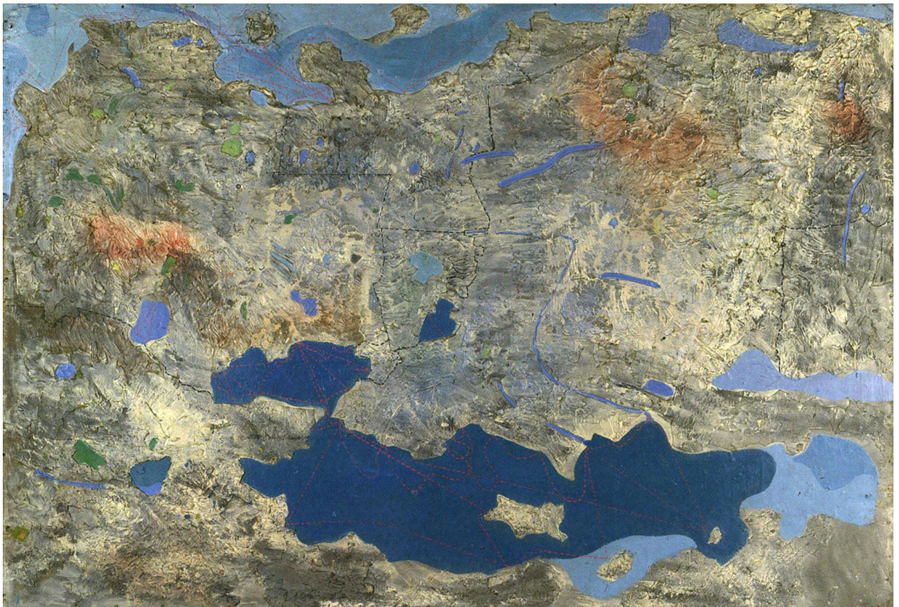
Abb. 1: Max Ernst, Europa nach dem Regen , 1933, Tempera und Öl auf Gips, partiell auch Stoff über Sperrholzplatte, 107 x 149 x 3 cm, Kunsthalle Karlsruhe.

Als Svetlana Alpers 1984 den „kartographischen Impuls“ in der Produktion von Bildern beschrieb, eröffnete sie einen Diskurs im Spannungsfeld zwischen Kartographie und Kunst, der weit über die von ihr in erster Linie untersuchte holländische Malerei des Goldenen Zeitalters hinausging. 1 Im Folgenden soll dieser Schnittstelle anhand von Max Ernsts 1933 entstandenem Werk Europa nach dem Regen (Abb. 1) nachgespürt werden.