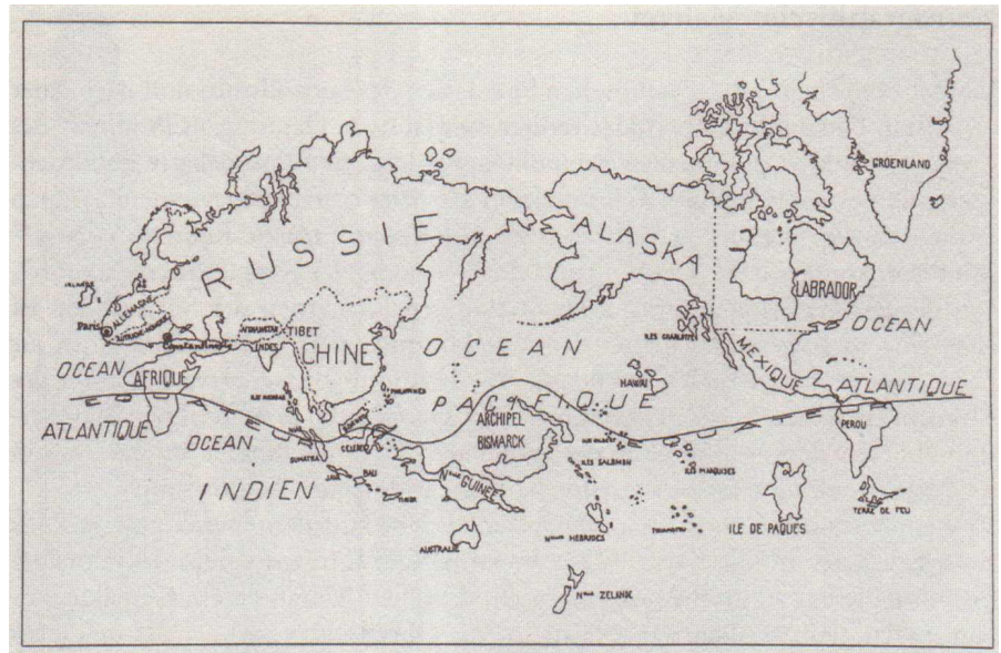
Abb. 4: Anonym, Surrealistische Weltkarte, veröffentlicht in Variétés. Le Surréalisme en 1929 , Brüssel 1929.

Proportionen der Länder und Inseln je nach künstlerischer Relevanz dieser Regionen für die Surrealisten alterieren. Die Landkarte spielt mit den Größenverhältnissen und den konventionellen Techniken der kartographischen Repräsentation (wie zum Beispiel der winkeltreuen Mercator-Projektion) und könnte in dieser Hinsicht eine Stellungnahme zu beziehungsweise eine Offenlegung der konstruierten Natur von Weltbildern sein, die immer nur eine von vielen möglichen Weltansichten zulassen.