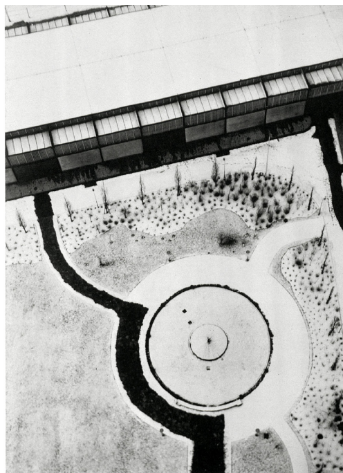
Abb. 2: László Moholy-Nagy, Funkturm, Berlin, 1928, 24,5 x 18,9 cm, Centre Pompidou Paris.

Der verstärkte kartographische Impuls der Zwischenkriegszeit hing nicht nur mit propagandistischen Forderungen zur Erweiterung des Lebensraumes zusammen, sondern kann auch als Reaktion auf die Entwicklung der Luftfotografie gesehen werden, die eine Verschiebung der Perspektive mit sich zog, die sich als Aufstieg in die Vertikale manifestierte. 3 Während des Ersten Weltkrieges wurden Luftaufnahmen vor allem zu militärischen Zwecken verwendet, um über aktuelle Bilder des Geländes und der Schlachtfelder zu verfügen, nachdem konventionelle Landkarten in der durch Schützengräben und Materialschlachten völlig zerstörten Landschaft obsolet geworden waren. 4 Ebenso bedienten sich aber auch avantgardistische Künstler wie z.B. André Kertész oder László Moholy-Nagy der Luftfotografie. Das „Neue Sehen“, das die Vogelperspektive ermöglichte, ließ neuartige formale Relationen sichtbar werden (Abb. 2) und näherte die Luftaufnahmen der abstrakten Kunst an.