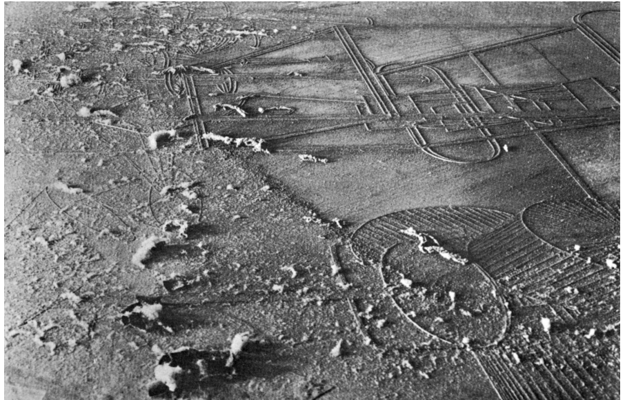
Abb. 3: Man Ray, Elevage de poussière , 1920, 18,5 x 29 cm.

Die Verfremdungseffekte, die durch diese Verschiebung des Augpunktes ausgelöst wurden, manifestieren sich besonders deutlich in der Staubzucht , Man Rays Fotografie von Marcel Duchamps La mariée mise à nu par ses célibataires, même (Abb. 3). Die Nahaufnahme des Großen Glases lässt zunächst vermuten, dass es sich bei den Bleiruten um eine Industrie- oder Fabriklandschaft handelt. 5 Diese Unsicherheit in Bezug auf den Maßstab begegnet einem ebenso in Europa nach dem Regen .