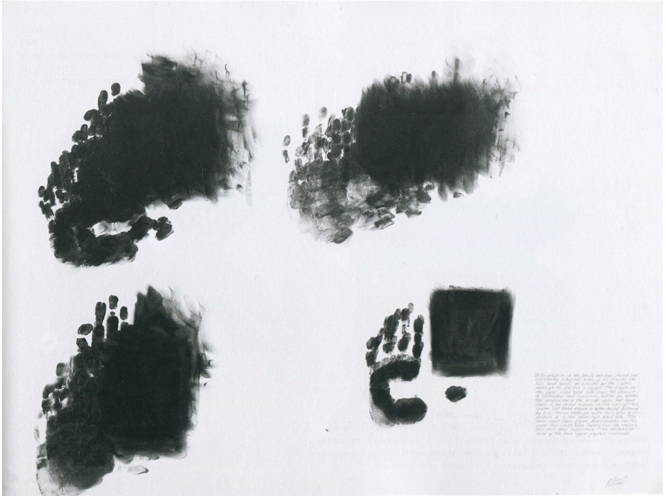
Abb. 2: Robert Morris Blind Time I , 1973, Graphitpulver und Leinöl auf Papier, 76,2 × 101,6 cm.

Transkription: With graphite on the hands and eyes closed and estimating a lapsed time of 60 seconds, the left hand serves as a guide for the right's attempt to blacken a square. The figure on the upper right hand side shows the attempt to remember and reproduce, motion for motion, the construction of the initial upper left hand figure. A one second exposure to the eyes of this upper left hand figure is experienced, followed by a 60 second attempt with eyes open to reproduce it in the lower left hand side. The lower right hand figure demonstrates how the upper two would have looked had the memory and skill had been sufficient. Time estimation error of the two upper figures: 0 seconds.